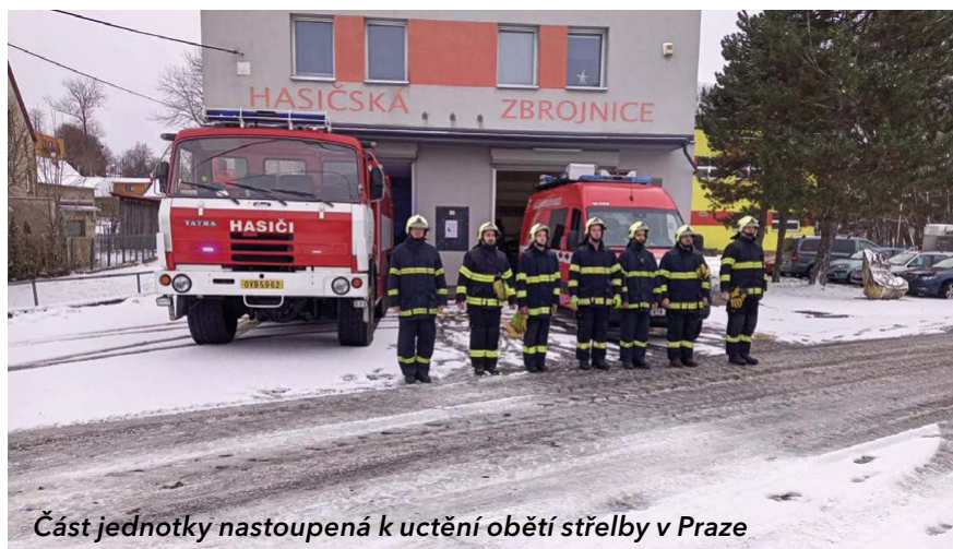
Část jednotky nastoupená k uctění obětí střelby v Praze

Počty výjezdu se různí - záleží na okolnostech (kalamity, povodně, požáry, technické pomoci, pomoc zdravotnické záchranné službě apod.).