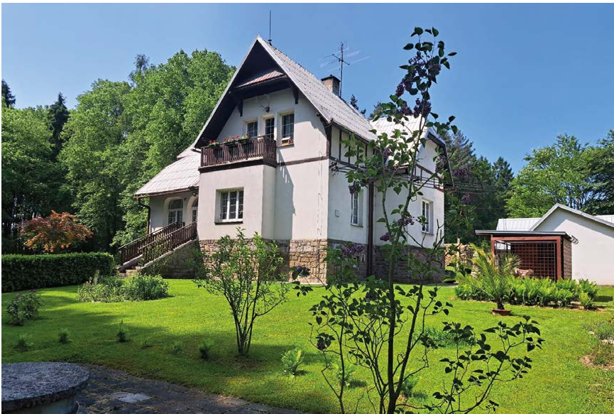
Plesenská hájenka s upraveným okolím

tovi. Sv. Hubert je patron myslivců, loveckých psů a sokolníků. Inspirovalo mne jedno pěkné zastavení v severních Čechách, tak jsem chtěl tuto tradici přinést k nám na toto pěkné místo.