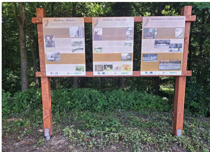
Naučná tabule o myslivosti u hájence