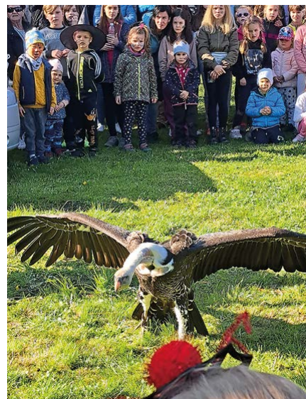
Ukázka dravých ptáků