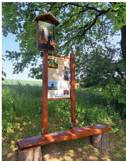
Naučná tabule o Sv. Hubertovi

mluví se tady také o psíku mývalovitém nebo o jezevcích. Máme u nás nějaká zvířata, o nichž lidé ani neví, že tu s námi žijí?