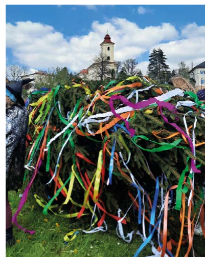
Zdobení máje na Májové Plesné

Karla Svobody 183, Ostrava – Plesná (budova Hasičské zbrojnice)