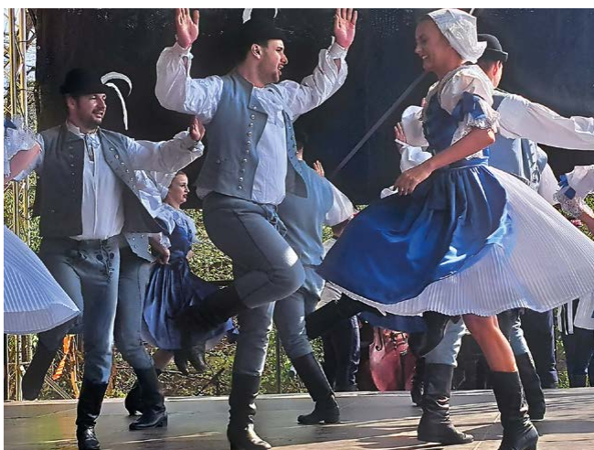
Soubor Břeclavan, pásmo z Myjavy