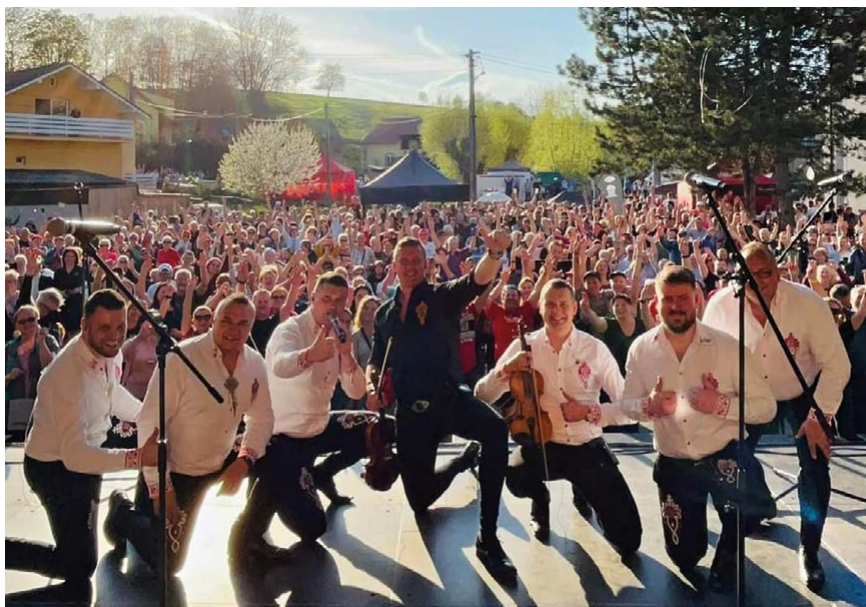
Rozlučková fotografie, foto: Kollárovci