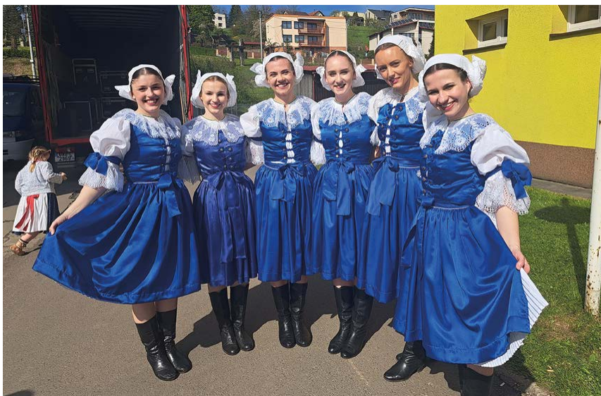
Tanečnice v myjavských krojích