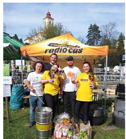
Tým Radia Čas s výhrami