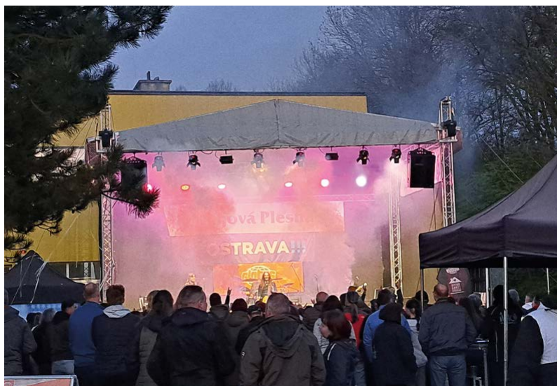
Vystoupení kapel se světelnými efekty