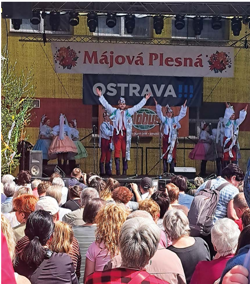
Hody, hody ... tance z Podluží