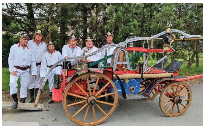
Hasiči veteráni