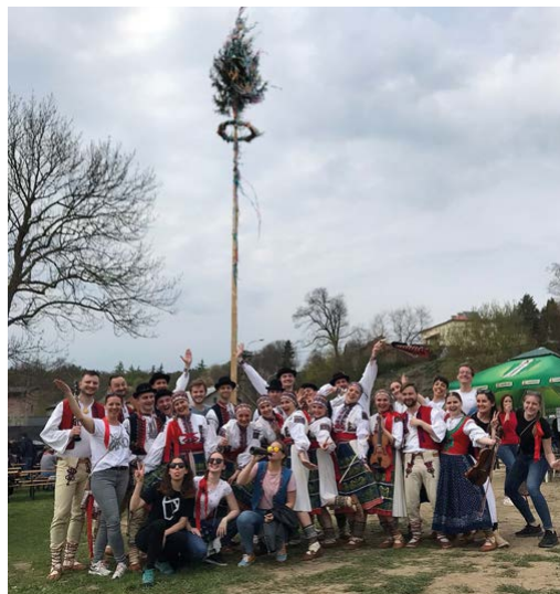
Májová Plesná