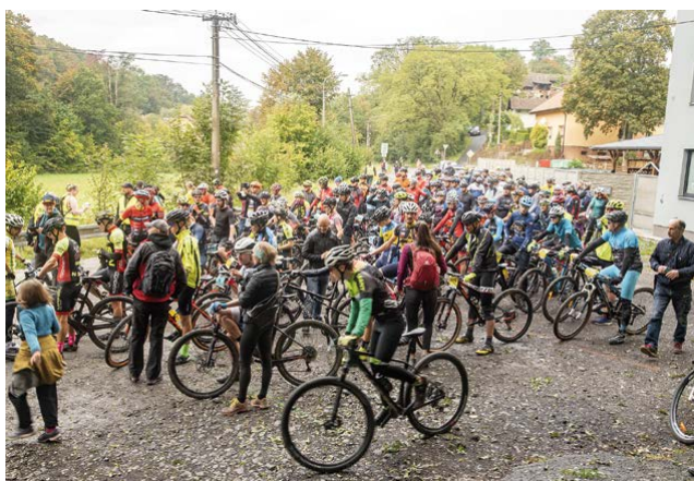
Před startem Plesenské stezky