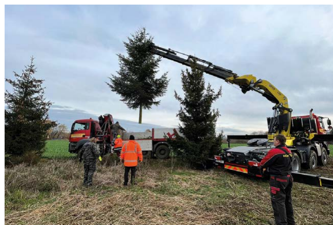
Výběr vánočního stromu; foto Pavel Hrbáč