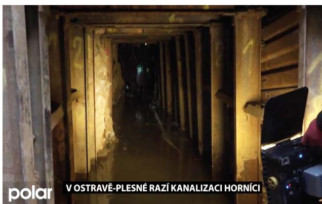
Horníci kopou kanalizaci; reportáž TV Polar