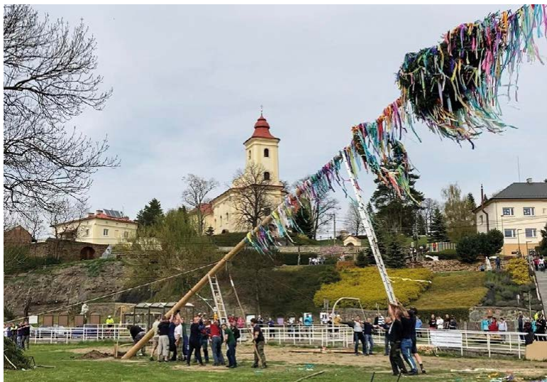
Stavění máje