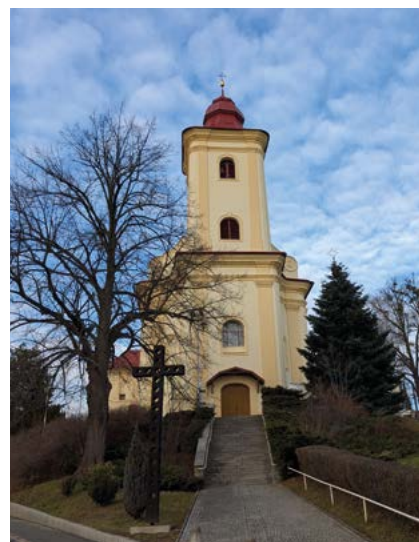
Kostel svatého Jakuba se může pyšnit nově opravenou věží.