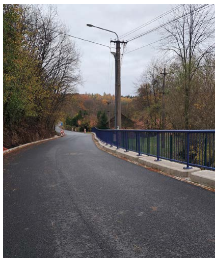
Opravený úsek ul. 26. dubna

V roce, který se pomalu blíží ke svému závěru, se podařilo realizovat celou řadu věcí. Proběhla rekonstrukce cesty na ulici 26. dubna, byla vybudována opěrná zeď se zábradlím podél bývalého rybníka u mlýna. Povedlo se zahájit dlouho očekávanou realizaci chodníků, v aktuální době v délce 850 m. Nové přístupové chodníky se realizovaly a nadále realizují na místním hřbitově. Zahájena byla první etapa výstavby nového hřiště Hrabek.