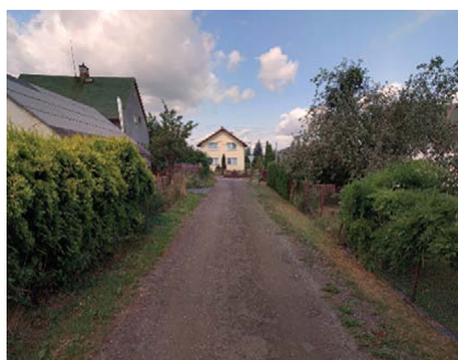
Ul. U Pískovny před rekonstrukcí

v jehož případě doufáme, že bude konečně úspěšné.