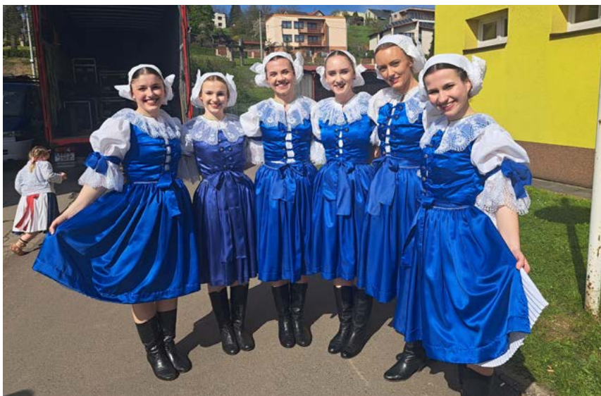
Tanečnice v myjavských krojích