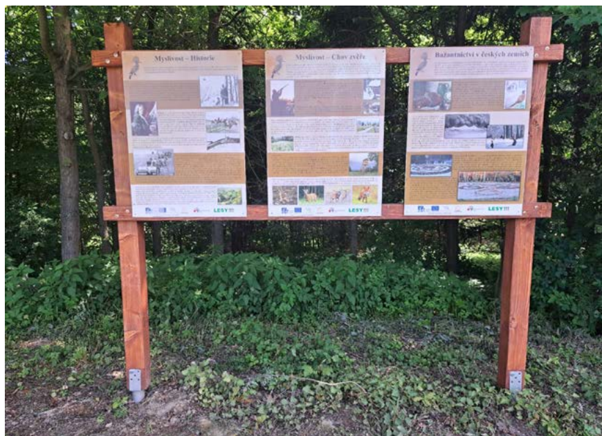
Naučná tabule o myslivosti u hájence