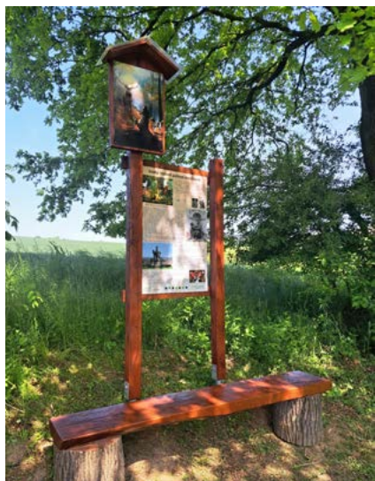
Naučná tabule o Sv. Hubertovi

mluví se tady také o psíku mývalovitém nebo o jezevcích. Máme u nás nějaká zvířata, o nichž lidé ani neví, že tu s námi žijí?