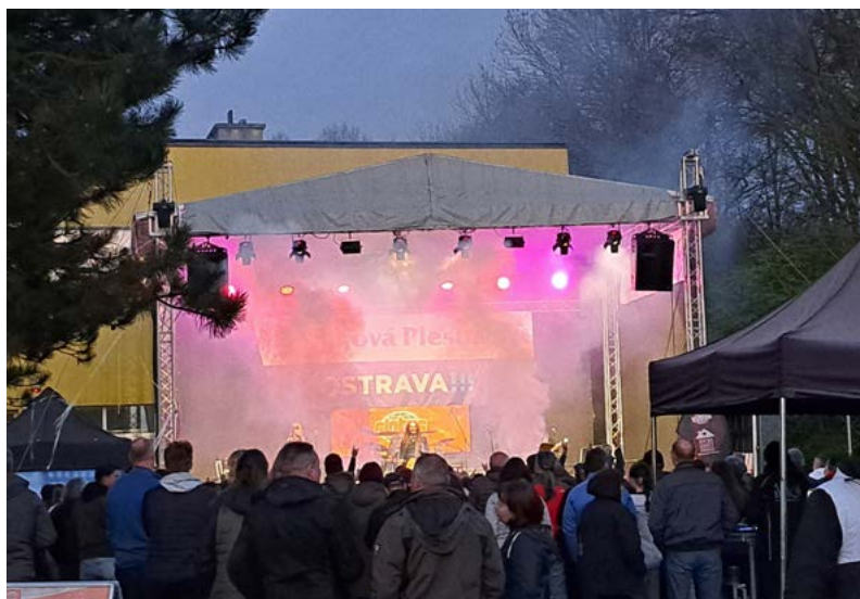
Vystoupení kapel se světelnými efekty