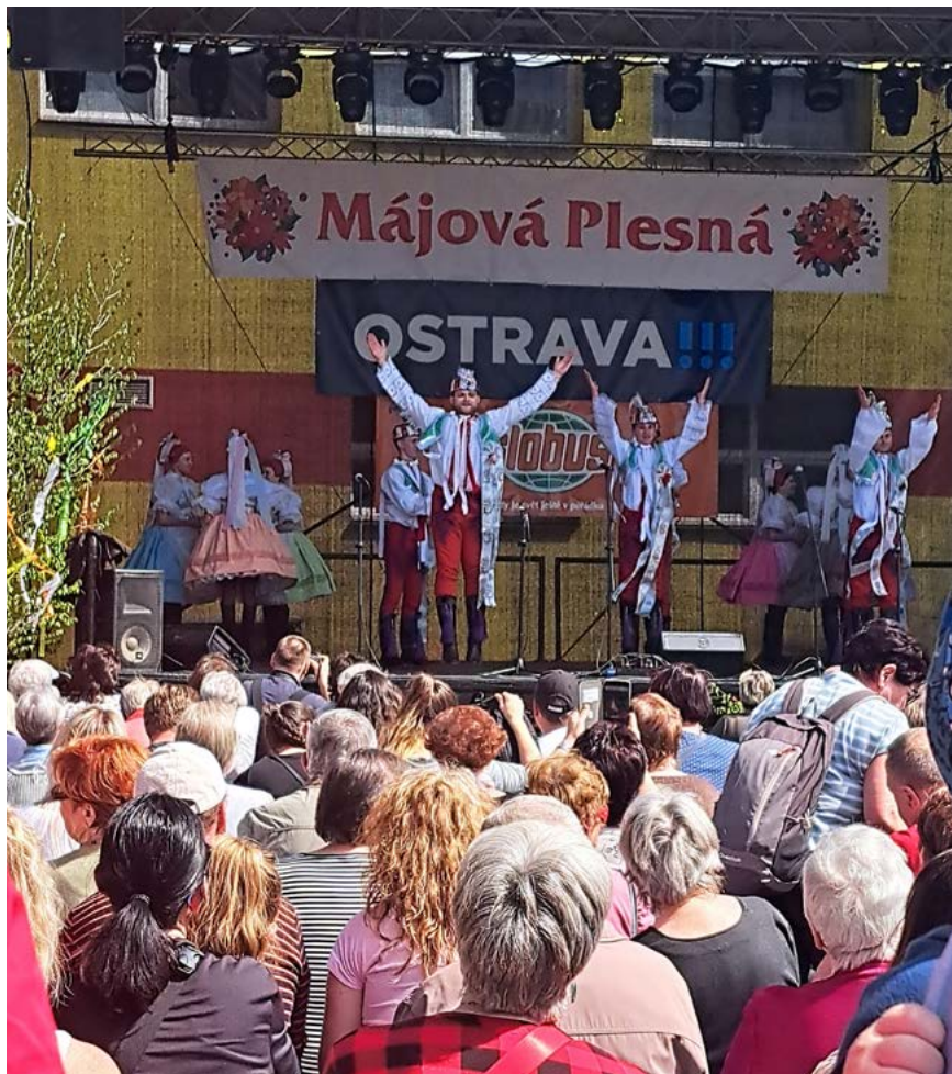
Hody, hody ... tance z Podluží