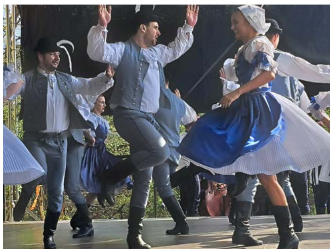
Soubor Břeclavan, pásmo z Myjavy