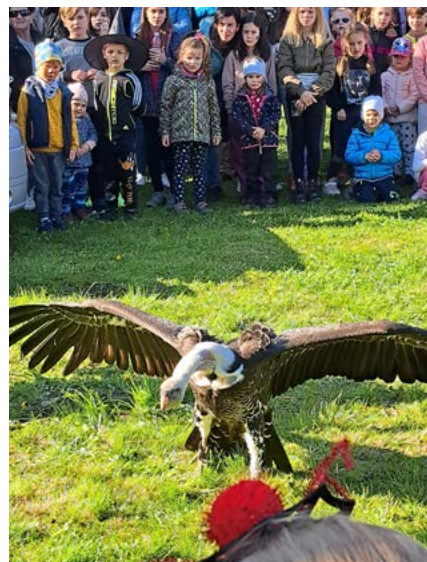
Ukázka dravých ptáků