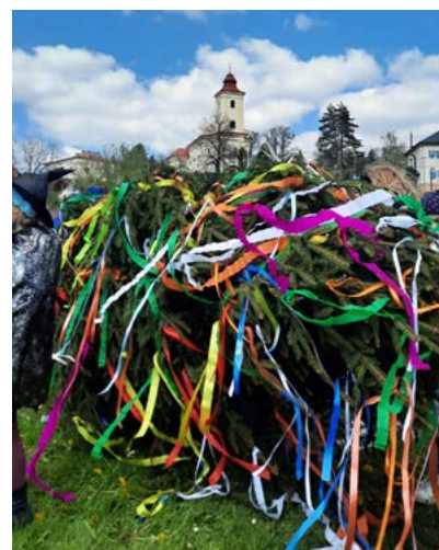
Zdobení máje na Májové Plesné