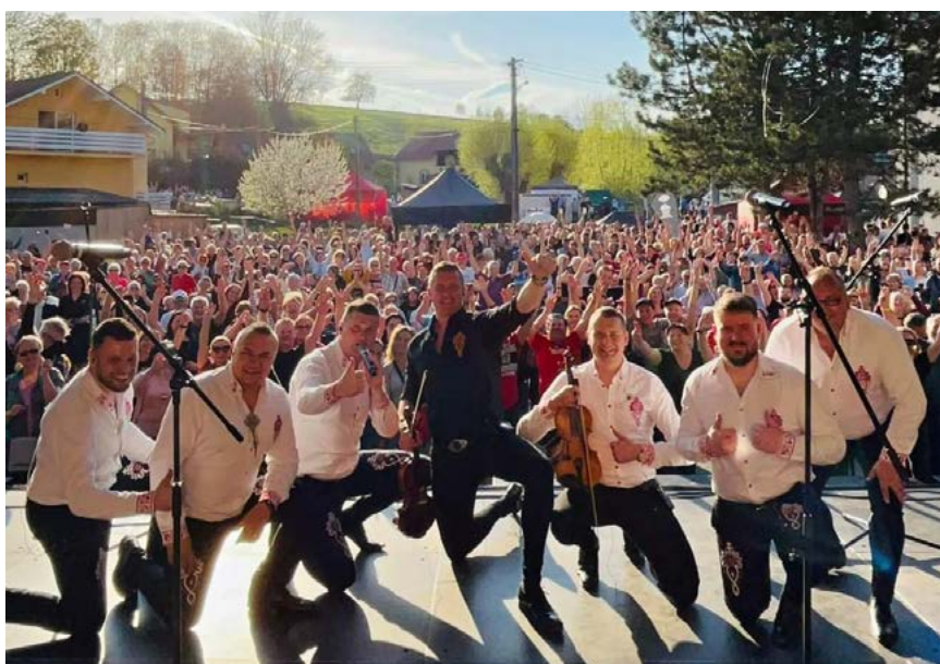
Rozlučková fotografie, foto: Kollárovci