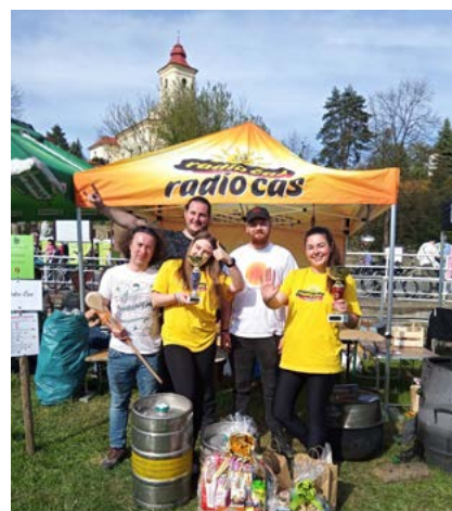
Tým radia Čas s výhrami