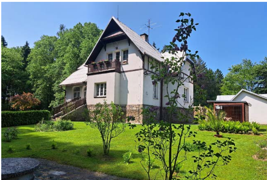
Plesenská hájenka s upraveným okolím

tovi. Sv. Hubert je patron myslivců, loveckých psů a sokolníků. Inspirovalo mne jedno pěkné zastavení v severních Čechách, tak jsem chtěl tuto tradici přinést k nám na toto pěkné místo.